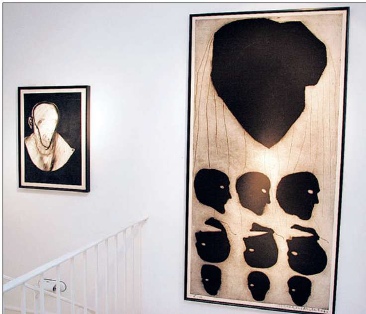
Un art qui intrigue et qui bouscule.

Rien ne peut laisser indifférent chez Neumann. Ses personnages projettent une angoisse, des craintes, des éléments persécutifs indéniables. Dans une tempête, ainsi, c'est un étrange couple, accolé comme des siamois, hiératiques dans leur habit noir dont nous distinguons seulement la base du cou et le front blafards, aux mains crispées noires, agressives qui nous font face, le visage dissimulé sous un masque fendu au niveau du regard. Sont-ils humains? Ou le fruit de cauchemars et de fantasmes? Tout le travail de l'artiste est basé sur cette ambiguïté qui lui donne sa force émotionnelle. Ailleurs, c'est l'intérêt qu'il porte à Fer-